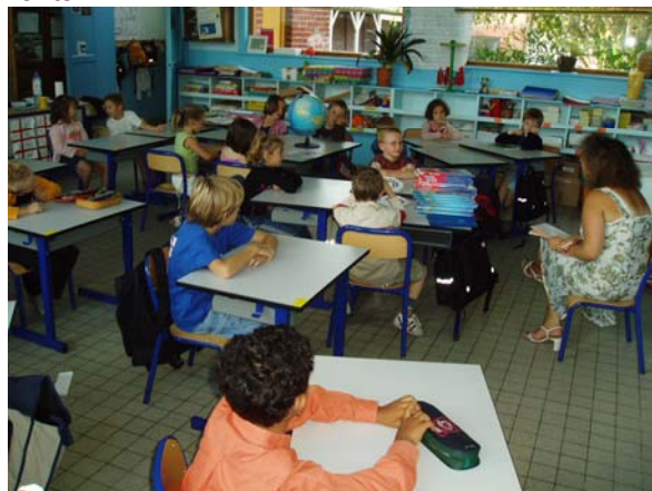
La rentrée du cycle 2

Vive les retrouvailles ! Les enfants ont été contents de trouver de nouvelles places dans leurs classes. Chez les petits, quelques pleurs chez les enfants et de "gros coeurs" chez les parents.