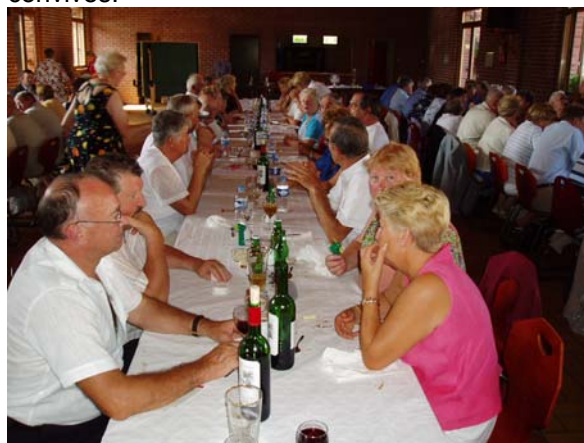
Beaucoup de monde pour le cassoulet

Le dimanche, le cassoulet maison cuisiné par l'association du bon accueil a ravi tous les convives.