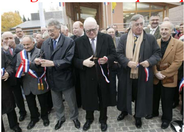
Les personnalités coupent le ruban