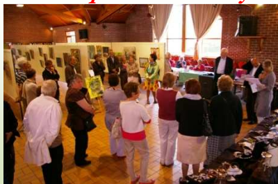
La journée des Artistes organisée le 1 er

mai par l'office de tourisme de Weppes, sur le thème « villages des Weppes » s'est tenue au foyer rural d'Ennetières-en-Weppes ainsi qu'à Fournes. Elle a attiré de nombreux visiteurs et amateurs d'art. Cette manifestation est le fruit de la collaboration de trois villages : Ennetières, Escobecques et Radinghem.