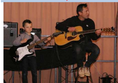
Le concert Rock de l'école de musique

est toujours un événement dans le village où il est très attendu.