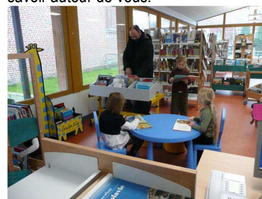
Les élèves à la bibliothèque

Notre école est de qualité, il faut le faire savoir autour de vous.