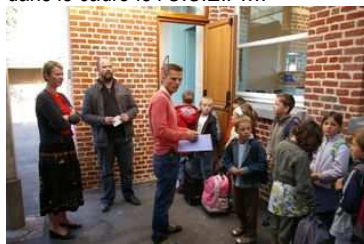
Une partie de l'équipe enseignante.