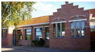
L'école complètement rénovée.

A la veille du week-end de Pâques, au retour de la classe verte, une mauvaise surprise attendait le directeur de notre école, au retour de sa classe verte: un mail lui annonçait qu'une fermeture de classe était envisagée pour l'école d'Ennetières.