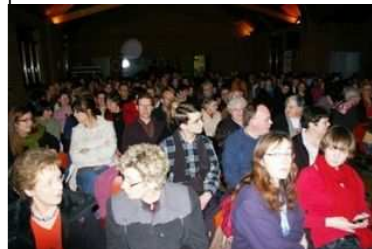
Que de monde !

Punch" et quelques mignardises offerts par le comité des fêtes.