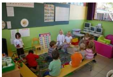
La classe de maternelle

Il existe une Association des Parents Elèves qui vient aider les enseignants et mettre de la vie dans l'école : accompagnement piscine ou vélo, animation à Noël et à la fin de l'année scolaire.