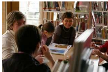
Lecture et bonne humeur.