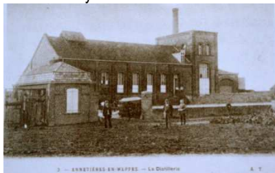
La distillerie de la Fosse